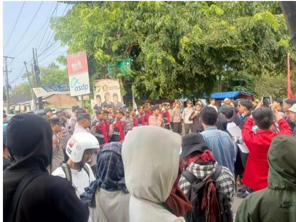
Gambar 3 Aksi Jilid 2 Masyarakat Cibetus

dan relasi manusia dengan alam. Berikut ini dokumentasi pada saat aksi demonstrasi dan ishtigosah serta buka puasa bersama pada saat bulan ramadhan: